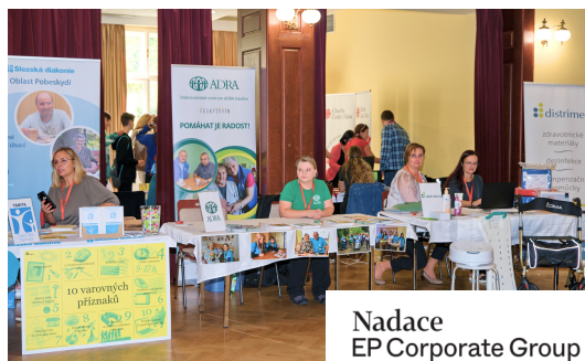
Nadace EP Corporate Group

Díky městu Český Těšín a Nadaci EP Corporate Group proběhl začátkem října v Kulturním a společenském středisku KaSS v Českém Těšíně druhý ročník Miniveletrhu sociálních služeb spojeného s konferencí. Hlavním pořadatelem této akce byla Charita Český Těšín společně s pracovní skupinou komunitního plánování „Senioři“.